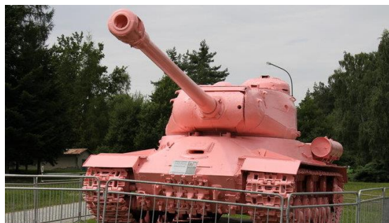
شکل ۳. تانک رنگ شده به دست دیوید چرنی (URL4)

چرنی در جسورانه‌ترین اقدام هنری خود، تانک یادبود ارتش سرخ در پراگ را به رنگ صورتی درآورد. اقدامی که به دستگیری فوری او انجامید. مقامات سریعاً تانک را به رنگ نظامی زیتونی اولیه بازگرداندند، اما این پایان ماجرا نبود. فشار افکار عمومی و حمایت پارلمان چک باعث شد در نهایت تانک بار دیگر به رنگ صورتی بازگردد. چرنی در کنفرانس مطبوعاتی توضیح داد که این پروژه نه یک شوخی، که تلاشی برای شکستن پذیرش منفعلانه تاریخ توسط مردم بود. صورتی‌کردن تانک، راهی برای خلع سلاح نمادین این ابزار جنگ و بیداری وجدان سیاسی جامعه است (شکل ۳).