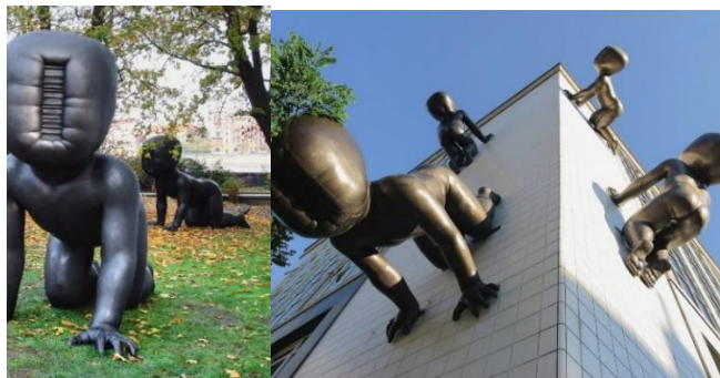
شکل ۴. مجسمه «بچه‌ها» از دیوید چرنی (URL5)

گرافیتی هنر اعتراضی و الهام‌بخشی است که به شکل غیرقانونی اتفاق می‌افتد و گرافرها هویت خود را پنهان می‌کنند. مهم‌ترین گرافیتی‌کار معاصر، بنکسی ۳۱ است. هنرمندانی مانند بنکسی ردای خود را در خیابان‌های سراسر جهان به تن کرده‌اند و از هنر برای مقابله با موضوعاتی مانند فساد سیاسی، مصرف‌گرایی و نقض حقوق بشر استفاده می‌کنند (Blanché, 2023, 2). بنکسی با مهارتی کم‌نظیر، توانسته است با آثار خود مستقیماً به قلب مسائل اجتماعی نفوذ کند. این ویژگی منحصر به فرد، او را به یکی از تأثیرگذارترین هنرمندان معاصر تبدیل کرده است. گرافیتی‌های او که عمدتاً در فضاهای شهری خلق می‌شوند، بینندگان را وادار می‌کنند تا درباره چالش‌هایی مانند مصرف‌گرایی افراطی، نابرابری اقتصادی و پیامدهای جنگ تأمل کنند (Gesare, 2024, 17).