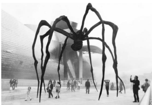
شکل ۲. مجسمه عنکبوت مقابل موزه گوگنهایم بیلباو (URL2)

هامبورگ، موزه هنرهای معاصر کانزاس سیتی، موزه هرمتاژ (سن پترزبورگ)، موزه گوگنهایم بیلباو و موزه هنر موری (توکیو) نصب شوند. این اثر که در ظاهر عنکبوتی عظیم‌الجثه و غیرمتعارف است، با نمادپردازی عمیق از مفهوم مادری قدرتمند، مخاطب را به تأملی نو درباره مفاهیم انسانی دعوت می‌کند (شکل ۲).