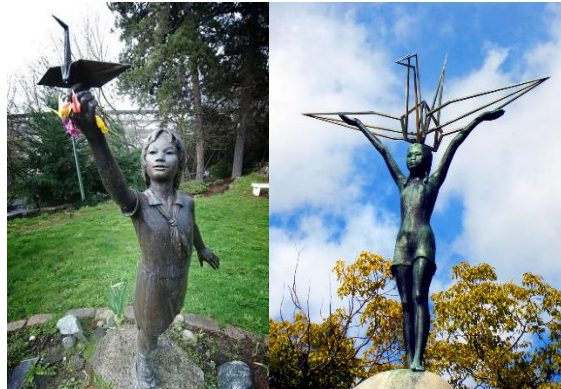
شکل ۵. مجسمه‌های ساداگو ساساکی در ژاپن (URL 6)