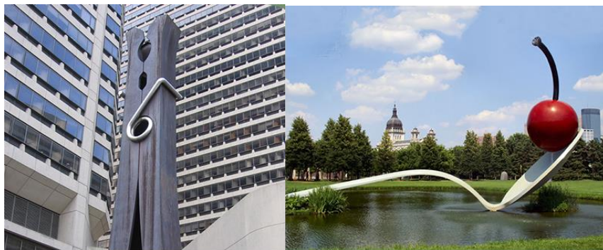
شکل ۱. مجسمه‌های محیطی اثر کلاس اولدنبرگ (URL1)

غیرمنتظره بودند، همچون یادمان‌های عمومی طراحی شده بودند. این ترکیب هوشمندانه از شوخ‌طبعی و سوررئالیسم، با استفاده از ابعاد غریب و اشیاء پیش‌پاافتاده، مخاطب را به حیرت وامی‌داشت. اولدنبرگ با این رویکرد، هم ذائقه یادمان‌گرای مخاطب را به چالش می‌کشید و هم آن را ارضاء می‌کرد، وادارشان می‌کرد درباره انتخاب‌های معمول‌شان برای پاسخ به این گرایش‌ها بازاندیشی کنند (Lynton, 2003, 345). مجسمه‌های معروف «گیره» در فیلادلفیا و «قاشق» در مینیاپولیس، از آثار ماندگار اولدنبرگ به‌شمار می‌روند که امروزه به جاذبه‌های گردشگری این شهرها تبدیل شده‌اند (شکل ۱). این آثار با نگرش منحصر به فرد پاپ‌آرت اولدنبرگ خلق شده‌اند که از دو جنبه حائز اهمیت است: نخست، ویژگی‌های متمایز هنری این مجسمه‌ها و دوم، تعاملی که با فضای شهری برقرار می‌کنند. اولدنبرگ با این رویکرد، هنر را از گالری‌ها به فضای عمومی شهرها آورده و در دسترس عموم مردم قرار داده‌است.