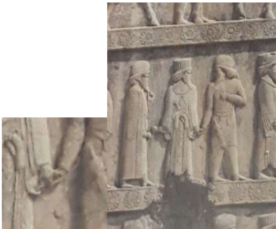
شکل‌های ۹ و ۱۰. حجاری در تخت جمشید

در اینجا برای تحلیل از بینامتنیت استفاده می‌شود. دست در دست داشتن نشانه مهر، محبت و حمایت است که با تبارشناسی آن در نمادهای به‌جا مانده، به متنی (در اینجا نماد حجاری‌شده) برخوردی که بافاصله زمانی نزدیک به ۲۴۰۰ سال این نشانه همچنان دیده می‌شود و در حجاری‌های تخت جمشید به‌ویژه در کاخ سه‌در و نیز پلکان‌ها که توصیف بار عام و مراسم‌های آن دوره است، این دست در دست داشتن دیده می‌شود (تصاویر ۹ و ۱۰).