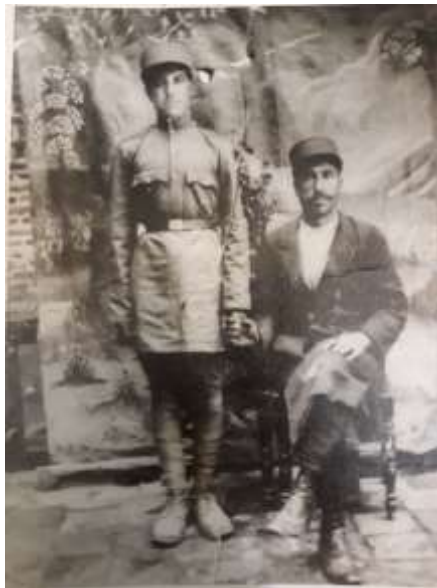
شکل ۷. سرباز و برادرش

این نوع تصاویر ماده خوبی برای تحلیل گفتمان هستند. در سطح توصیف می‌توان لباس، نحوه ژست‌گرفتن افراد و پس‌زمینه عکس را برای تحلیل گفتمان بررسی کرد. در برهه‌هایی نحوه ایستادن یا نشستن افراد در عکس متأثر از نحوه ایستادن هنرپیشه‌های معروف بوده است (سطح تفسیر). عکس‌های مناسبی نیز در سطح تفسیر می‌تواند مورد مطالعه قرار گیرد. در سطح تبیین، اکثریت عکس‌هایی که در محیط عمومی و جامعه گرفته شده می‌توان نشانه‌های فرهنگی را در پس‌زمینه عکس که منظره‌ای از بافت اجتماعی است (اعم از معماری، پوشش، مکان، زمان و غیره) ملاحظه کرد که بر سوژه‌های عکس مؤثر است و عکس مجدداً گفتمان موجود و مستقر را بازتولید می‌کند. در این بخش برای نمونه عکسی با قدمت ۹۶ سال از نخستین دوره خدمت وظیفه اجباری بر اساس روش فرکلانف مورد بررسی قرار می‌گیرد.