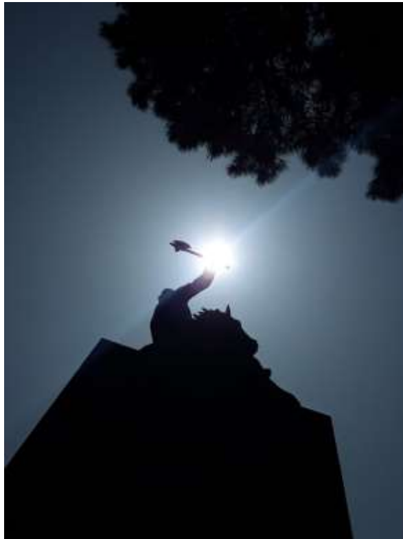
شکل ۴. مجسمه نادرشاه افشار در بالای ساختمان آرامگاهش

این تصویر به صورت ضد نور (سایه‌نما) که منبع نور در پشت سوژه است و سوژه به شکل سایه در عکس ثبت شده است و با جهت از پایین به بالا به طوری که پشت مجسمه به سمت مخاطب است گرفته شده است. این نوع تکنیک یکی از روش‌های انتقال حالت‌های عاطفی (ابهت، شک، اندوه و غیره) به بیننده است. ممکن است مخاطب با دیدن این نوع عکس‌ها به درک درست و واضحی از سوژه نرسد، اما بخش تیره و سیاه تصویر و کنتراست آن با نور زمینه باعث قدرت تخیل مخاطب می‌شود. همچنین زاویه عکاسی از پایین به بالا است که به کارگیری این زاویه معمولاً ابهت و بزرگی سوژه را در عکس به ذهن بیننده متبادر می‌سازد.