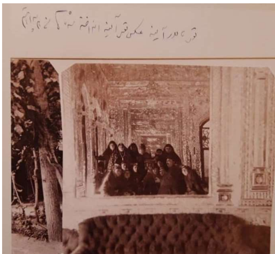
شکل ۱. عکس سلفی ناصرالدین‌شاه و زنان در تالار آینه کاخ گلستان به همراه دستخط پادشاه (Tahmasebpour, 2008, 35)

نخستین عکس‌ها به صورت فتاوری داگرتوتیپ ۱ در دوره محمدشاه (۱۸۴۲ میلادی/۱۲۲۱ هجری شمسی) تولید شد. سپس سیاحان در مسافرت‌های خود به عکاسی مبادرت می‌ورزیدند. با پیشرفت عکاسی و ورود دوربین‌های جدید در عهد ناصرالدین‌شاه و اهتمام و علاقه او به امر عکاسی، منجر به تأسیس عکاسخانه مبارکه همایونی و نیز تدریس عکاسی در مدرسه دارالفنون شد. تصاویر متعددی از مناظر و افراد گرفته شد که امروزه بخشی از میراث فرهنگی ایران است. ناصرالدین‌شاه خود عکاس نسبتاً ماهری شده بود که نماد آن توضیحات عکس‌ها و به‌ویژه عبارت «خودمان انداختیم» به خط خودش در کنار عکس‌ها است (شکل ۱).