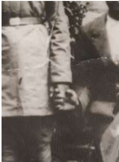
شکل ۸. دست در دست

در اینجا برای تحلیل از بینامتنیت استفاده می‌شود. دست در دست داشتن نشانه مهر، محبت و حمایت است که با تبارشناسی آن در نمادهای به‌جا مانده، به متنی (در اینجا نماد حجاری‌شده) برخوردی که بافاصله زمانی نزدیک به ۲۴۰۰ سال این نشانه همچنان دیده می‌شود و در حجاری‌های تخت جمشید به‌ویژه در کاخ سه‌در و نیز پلکان‌ها که توصیف بار عام و مراسم‌های آن دوره است، این دست در دست داشتن دیده می‌شود (تصاویر ۹ و ۱۰).