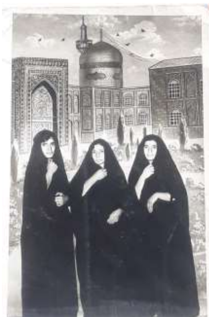
شکل ۵. تکنیک ترکیب: عکاسی با پس‌زمینه پرده نقاشی حرم مطهر، دهه ۴۰

امروزه با استفاده از نرم‌افزارهای مدرن عکاسی و گرافیکی مانند فتوشاپ، تری‌دی مکس، ایندیزاین و امثال آن بسیار سهل‌تر انجام می‌شود اما در گذشته این امور به صورت فیزیکی (به خصوص ترکیب) و یا هنگام چاپ به وسیله آگران‌دیسمان و گذاشتن نگاتیوها و فیلترهای نوری بر روی هم انجام می‌گرفت. به عنوان مثال تصاویر افراد در کنار تصاویر منقش به ضریح مطهر و بارگاه حضرت امام رضا(ع) که توسط عکاسی‌های مستقر در نزدیک حرم مطهر انجام می‌گرفت به عنوان نماد و یادگاری از سفر به مشهد و زیارت مضجع شریف آن حضرت به شمار می‌رفت.