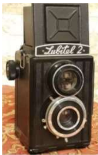
شکل ۲. دوربین دو ابژکتیو (دوچشمی) لوبیتل روسی

اما تا زمان مشروطیت عکاسی شخصی و خانوادگی بیشتر به معاریف، درباریان، خانواده‌های سرشناس، نظامیان (آن‌هم بیشتر در دارالخلافه تهران) منحصر بود و بعد از مشروطیت است که طبقات مختلف مردم نیز برای عکس‌گرفتن به عکاسخانه‌ها مراجعه می‌کردند. آنتوان سوریوگین، روسی‌خان، ژول ریشار، فرانسیس کارلهیان، ارنست هولتزر، مسیو پاپاریان، لوییجی مونتابونه، ژاک دمورگان و آلبرت هوتز از دیگر غیرایرانیانی هستند که طی سال‌های اولیه ورود عکاسی به ایران تصاویر بسیاری با موضوعات مختلف از زندگی اجتماعی و مناظر و معماری ایران آفریدند و بعضاً به آموزش عکاسی پرداختند. از دهه ۱۳۳۰ شمسی به بعد با ورود دوربین‌های روسی و آلمانی کوچک، خرید دوربین شخصی توسط افراد گسترش یافت. از نمونه‌های کلاسیک این دوربین‌ها می‌توان به دوربین لوبیتل ۲ روسی در دهه چهل شمسی اشاره کرد (شکل ۲).