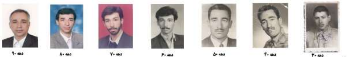
شکل ۳. نمونه‌ای از ۷ دهه عکاسی پرتره پرسنلی

در عکس‌های سیاه‌وسفید پشت زمینه عکس‌های پرسنلی کاملاً روشن بود اما با گسترش عکس‌های پرسنلی رنگی از پشت زمینه‌های دارای رنگ و طرح نیز استفاده می‌شد اما از اواخر دهه ۸۰ فقط عکس‌های رنگی پرسنلی مورد قبول اکثر ادارات قرار می‌گرفت که معمولاً تمام‌رخ و زمینه سفید بودند (شکل ۳).