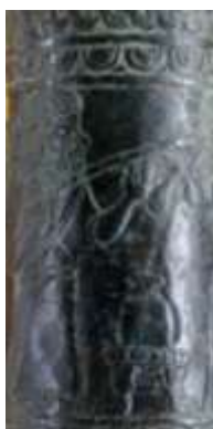
شکل ۶. جام برنزی لرستان (موزه هنر لیون فرانسه)

بر یک جام برنزی که در یک مجموعه خصوصی نگهداری می‌شود در یک ضیافت شاهانه یک نوازنده چنگ نیز حضور دارد (شکل ۵). بر روی یک ساغر برنزی دیگر یک نوازنده لوت دسته بلند دیده می‌شود (شکل ۶). این ساغر که ارتفاع آن ۱۱ سانتی‌متر است در موزه هنر لیون فرانسه نگهداری می‌شود و یک نمونه مشابه آن در موزه لوور قرار دارد. این دو ساغر برنزی در لرستان کشف شده‌اند.