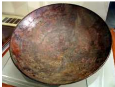
شکل ۱. جام ارجان و نقاشی نوار مربوط به موسیقی