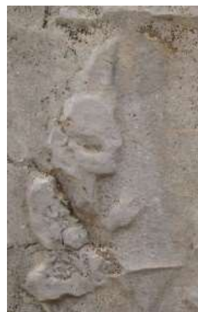
شکل ۱۱. چنگ کول‌فره