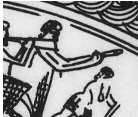
شکل ۱۴. لوت دسته‌بلند جام ارجان

با توجه به کمبود مدارک و بر اساس تعداد کم آثار نمی‌توان در مورد موقعیت و جایگاه سازها و نوازندگان نتیجه‌گیری قطعی نمود. آنچه از مطالب گفته شده می‌توان دریافت حضور چنگ را در مراسم رسمی مشخص می‌سازد. چه این مراسم یک ضیافت شاهانه باشد و چه یک بار عام و یا یک مراسم مذهبی-آئینی. به هر حال به نظر می‌رسد چنگ در این فرهنگ دارای نقش ویژه‌ای در مراسم رسمی بوده است. وجود چنگ‌هایی با ۹ و ۱۱ تار در این دوره (به شرط اعتماد بر تعداد دقیق تارها که توسط تصویرگر ترسیم شده است) اشاره به اجرای موسیقی در محدوده‌ای صوتی متنوعی است. همچنین گروه‌نوازی‌ها حکایت از دانش فواصل و دانش تنظیم ملودی برای سازهای گروه موسیقی دارد. حضور لوت دسته‌بلند نیز در این دوره میراث لوت‌های دسته‌بلند هزاره دوم است که نشانه‌های آن را در دست پیکرک‌های ایلامی که به تعداد زیاد یافت شده‌اند می‌توان دید.