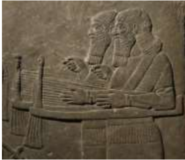
شکل ۱۰. چنگ نوازان آشوری (موزه بریتانیا)

نفر اول: ak. .ak. . . u ISu- un-ki- . . . (کتیه خراب شده است و معنی کلمه آخر مشخص نیست) (مصاحبه با دکتر عبدالمجید ارفعی).