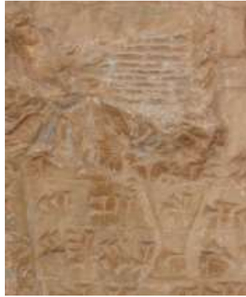
شکل ۹. چنگ کول فره