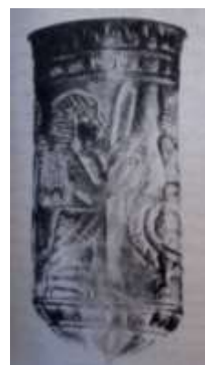
شکل ۵. جام برنزی لرستان (Saraf, 1980)