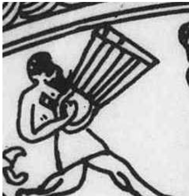
شکل ۱۵. لیر در جام ارجان

بر روی جام ارجان به دنبال گروه موسیقی، یک نوازنده لیر دیده می‌شود (شکل ۱۵). لیرها عموماً به حوزه تمدنی بین‌النهرین تعلق دارند که بر اساس یافته‌های باستان‌شناسی از سه هزار قبل از میلاد به صورت لیرهای گاو شکل در موسیقی این منطقه ایفای نقش می‌کنند. لیر در تمدن‌های ساکن در ایران باستان و به خصوص فرهنگ ایلام کمتر دیده می‌شوند. شمایل نقش شده از ساز کاسه‌گردی در پایین را نشان می‌دهد که تارها بر این کاسه عمود کشیده شده‌اند. لیر تصویر شده در این جام به لیرهای رایج در حوزه تمدنی قبرس و هیتی شباهت دارد و به نظر می‌رسد نوازندگان این ساز میهمان یا اسیران جنگی باشند (Farahani, 2017).