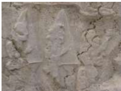
شکل ۳. صحنه دوم اجرای موسیقی در کول‌فره

حرکتند که در میان آن‌ها شش نوازنده چنگ در دو گروه دیده می‌شود (شکل ۴). این نقوش در سمت چپ بالای یک تخته سنگ نقش شده است.