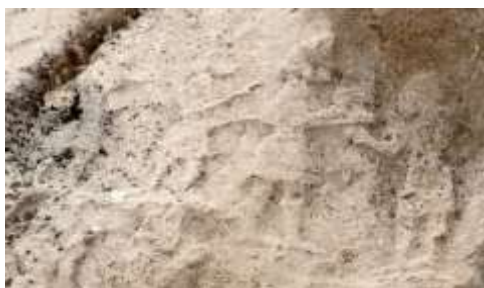
شکل ۴. صحنه سوم اجرای موسیقی در کول‌فره