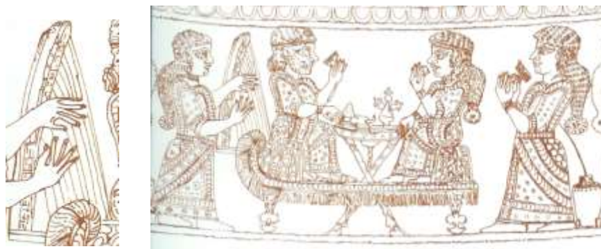
شکل ۷. تصویر جام برنزی لرستان و جزییات چنگ