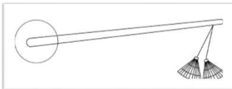
شکل ۱۳. بازنمایی لوت دسته‌بلند در ساغر برنزی

بر روی ساغر برنزی مکشوف از لرستان به وضوح نقش یک لوت دسته‌بلند دیده می‌شود. این نمونه که در موزه هنر لیون نگهداری می‌شود نیمه هزاره اول بین سال‌های ۵۴۰ تا ۶۱۲ قبل از میلاد تاریخ‌گذاری شده است. احتمالاً این نمونه تنها مورد کشف شده از این نوع لوت دسته‌بلند در این دوره است. در این ساغر نوازنده لوت همراه با آتشدان پادشاه که می‌تواند نمایانگر یک مراسم مذهبی در حضور شاه باشد نشان داده شده است. در هزاره دوم قبل از میلاد نمونه‌های بسیار زیادی از پیکرک‌های سفالی در دست است که لوت‌های دسته‌کوتاه و دسته‌بلند در دست دارند. با توجه به وضع ظاهری این پیکرک‌ها که عریان هستند و با توجه به نشانه‌های موجود بر پیکرک‌ها به نظر می‌رسد کارکرد آئینی داشته‌اند (Farahani, 2019). در اینجا نوازنده با لباس کامل ترسیم شده است و با توجه به وجود آتشدان و شاه می‌توان این ساز را در مراسمی مذهبی با حضور شاه متصور شد. از انتهای دسته ساز دو ریسمان که آویزان است که انتهای آن تزئین شده و نشان‌دهنده وجود دو تار بر روی این ساز است. دسته نیز تا روی کاسه امتداد دارد. کاسه ساز بسیار کوچک است و نوازنده کاسه را بر روی سینه قرار داده است (شکل ۱۳).