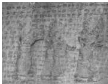
شکل ۲. اولین صحنه اجرای موسیقی در کول‌فره