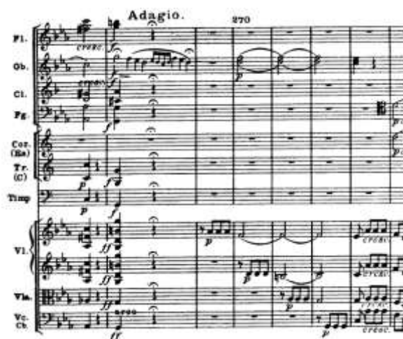
شکل ۶. کارکرد سکوت برای ایجاد تنش، قسمتی از مومنان اول سمفونی پنجم، اثر بتهوون (Unger, 1976, 139)

این کارکرد سکوت تاحدی در ارتباط با تنش نمایشی حاصل از سکوت در اُپراست که قبلاً به آن اشاره شد. البته تنش در موسیقی متأثر از سایر عناصر صدایی هم می‌تواند روی دهد؛ مانند اینکه سازی خاص در یک اثر ارکستری برخلاف جریان هارمونی بنوازند و درحقیقت نوعی تضاد هارمونیک فاحش را با بقیه سازها به گوش برسانند و از این طریق با نشان دادن نوعی از تک‌گویی و انزوا، بر تنش احساسی موسیقی بیفزایند. اما متناسب با موضوع مورد بحث، استفاده خاص از سکوت می‌تواند به خوبی کاهش و افزایش تنش را به همراه داشته باشد؛ مثلاً سکوت در زمانی که کاملاً انتظار شنیده شدن یک اتفاق صدایی وجود دارد می‌تواند اشتیاق نسبت به ادامه شنیدن را افزایش دهد و پیش‌بینی جریان موسیقی را در ذهن شنونده آورد.