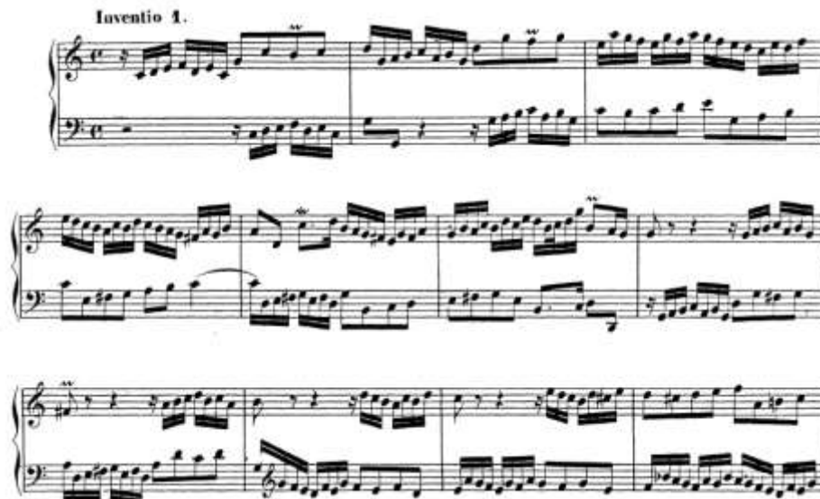
شکل ۴. قسمت ابتدایی از انواسیون شماره ۱، اثر باخ برای ساز کلایه‌ای (1, 1853, Becker)

شکل‌دهی به گفت‌وگوی عبارت‌ها به صورت سکوت چنگ به سیاه به دولاچنگ شنیده می‌شود که حالت سؤال و جواب را بین دو خط صدایی ایجاد کرده است.