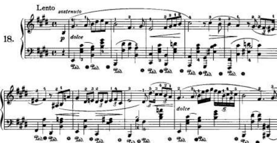
شکل ۳. نمونه‌ای از کارکرد سکوت برای عبارت‌بندی در اثری از شوپن برای پیانو (Joseffy, 1915, 88)

عبارت‌بندی با استفاده از سکوت در قالب ارتباط کلام با موسیقی و به‌عنوان وقفه مفهومی و نفس‌گیری لازم برای خواننده به‌خصوص در قطعات آوازی به‌وضوح درک می‌شود هرچند قواعد ساختاری کلام و موسیقی در برخی موارد کاملاً متفاوت هستند (Masoudieh, 2011, 26). نیاز به نفس‌گیری خود را به‌صورتی ملموس در بسیاری از آثار موسیقی می‌نمایاند و حتی در موسیقی‌سازی (بدون آواز) هم به تبعیت از موسیقی آوازی به‌کار می‌رود و جلوه‌ای مشابه با آوازخواندن می‌یابد؛ مثلاً می‌توان به ضب‌های مختلف از قطعات این نوع موسیقی به‌صورت تکنوازی یا هم‌نوازی اشاره کرد که در آنها صدای نفس نوازندگان یا رهبر موسیقی در حین سکوت، برای مشخص نمودن شروع عبارت‌ها یا ورود و خروج نوازندگان در قسمت‌های مختلف شنیده می‌شود، انگار که برای اجرای موسیقی تنفس می‌کنند درحالی‌که قرار است بنوازند نه اینکه بخوانند.