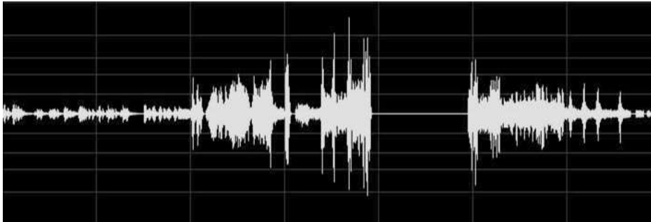
شکل ۱. نمودار موج صوتی موومان سوم از قطعه چهاردیواری، اثر کیچ، تولیدشده با نرم‌افزار ادوبی آئودیشن توسط مؤلف

در این نمودار محور افقی زمان و محور عمودی شدت صداست و خط ممتد، سکوت با طول زمانی زیاد را مشخص می‌کند. بررسی نشان می‌دهد که طول زمانی این موومان تقریباً هفت دقیقه و طول زمانی سکوت حدوداً یک دقیقه است که چنین استفاده‌ای از سکوت، پیش از کیچ رایج نبوده است. البته برای دریافت یک معنا و مفهوم ممکن از این موومان قطعه چهاردیواری متناسب با مطالعهٔ پساساختارگرایانه، به ارتباط بینامتنی و شناخت نقش سکوت و چگونگی صدا در موسیقی‌های پیرامونی دیگر نیاز است؛ یعنی کیفیت موسیقایی چنین قطعاتی بر اساس موسیقی بودن قطعاتی دیگر از بطن رپرتوار موسیقی مربوط، مشخص و تعریف می‌شود که می‌تواند متعلق به همان آهنگساز باشند یا از گونه‌ای مشابه و حتی متضاد انتخاب شده باشند.