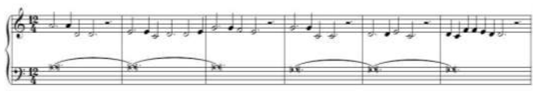
شکل ۲. ابتدای قطعه این روزها، اثر لئونن، بازنویسی شده برای ارگ (Aboyan, 2002, 1)

آشکارترین کارکرد سکوت در موسیقی، مشخص کردن آغاز و پایان عبارت‌ها است و از اولین نمونه‌های موسیقی کلاسیک غرب می‌توان ردپای آن را شنید؛ مثلاً در شکل ۲ که ابتدای قطعه این روزها ۲۱ از لئونن ۲۲ به عنوان آهنگساز قرون وسطی دیده می‌شود، سکوت سفید نقطه‌دار همچون نقطه در نوشتار، جداکننده عبارت‌های موسیقایی است و نقش حدفاصل خود را در انتها و ابتدای آنها نشان می‌دهد.